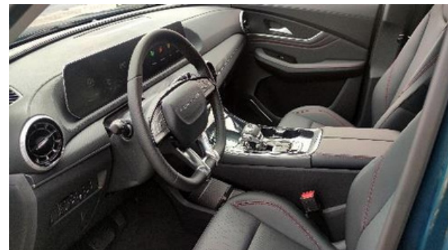
TAPICERKA SKÓRZANA JEDNOBARWNA CZARNA